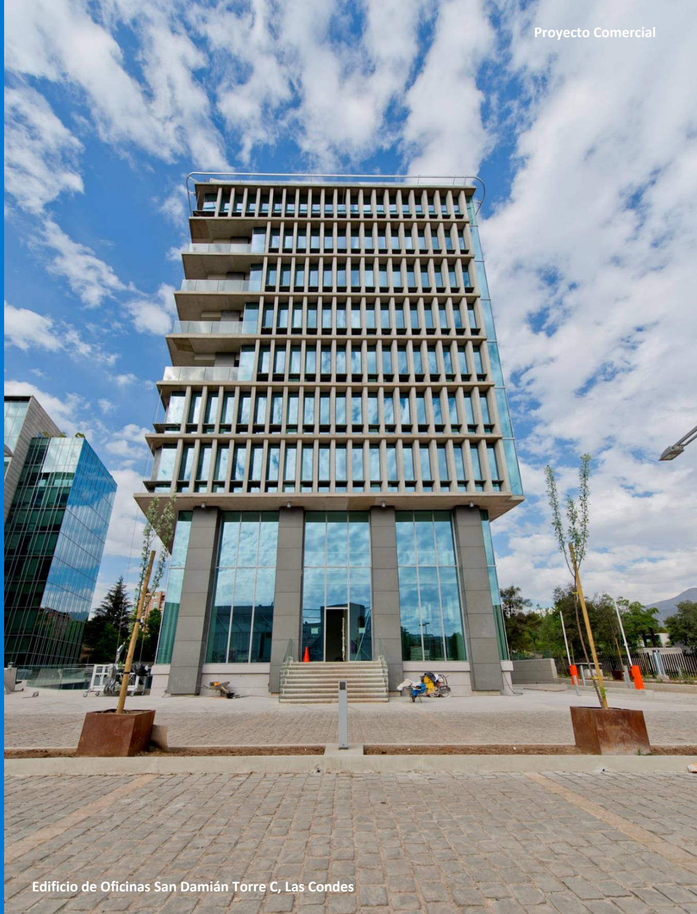
Edificio de Oficinas San Damián Torre C, Las Condes