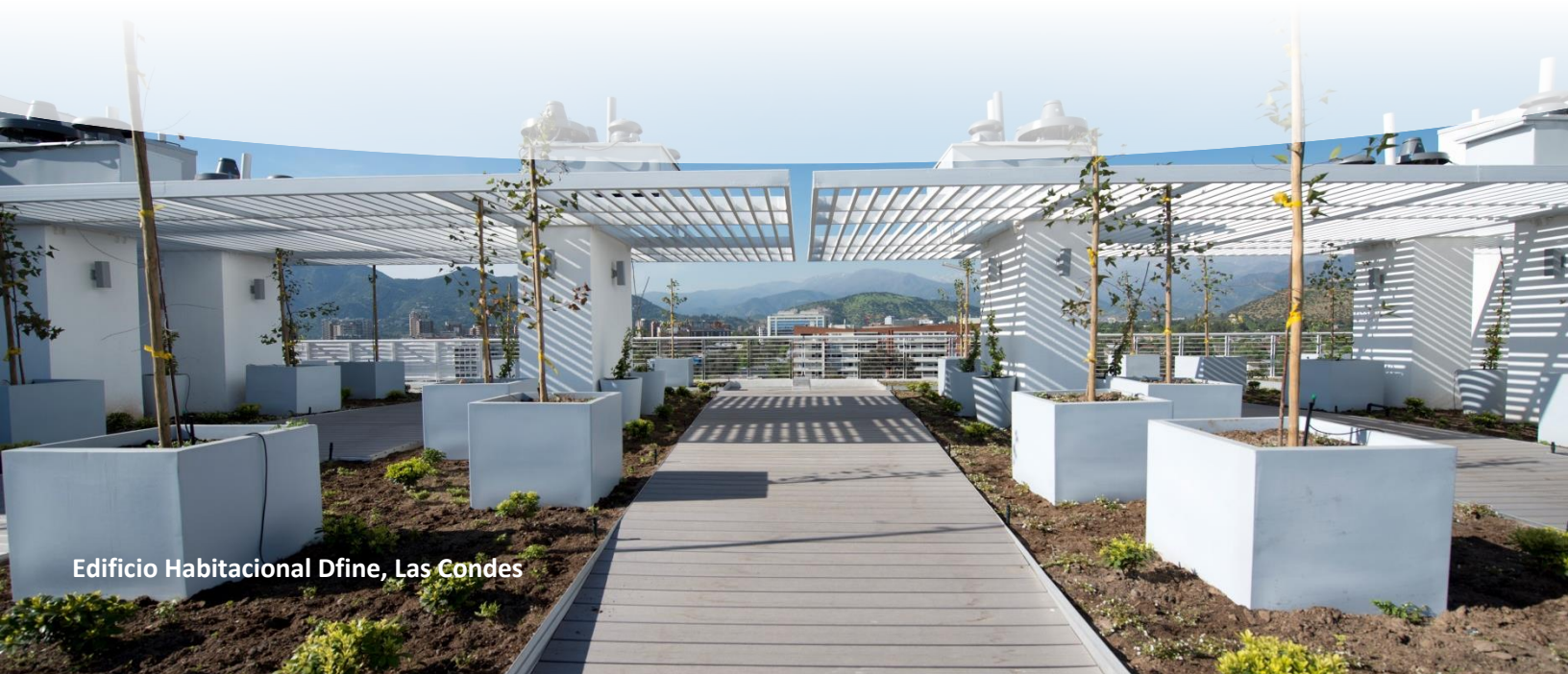
Edificio Habitacional Dfine, Las Condes