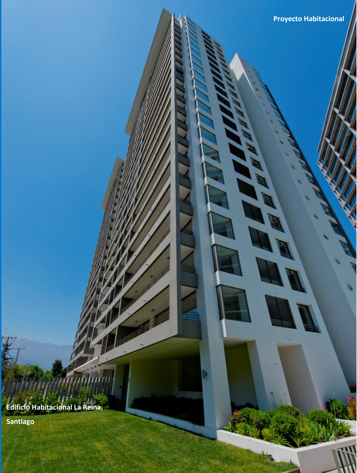
Edificio Habitacional La Reina, Santiago