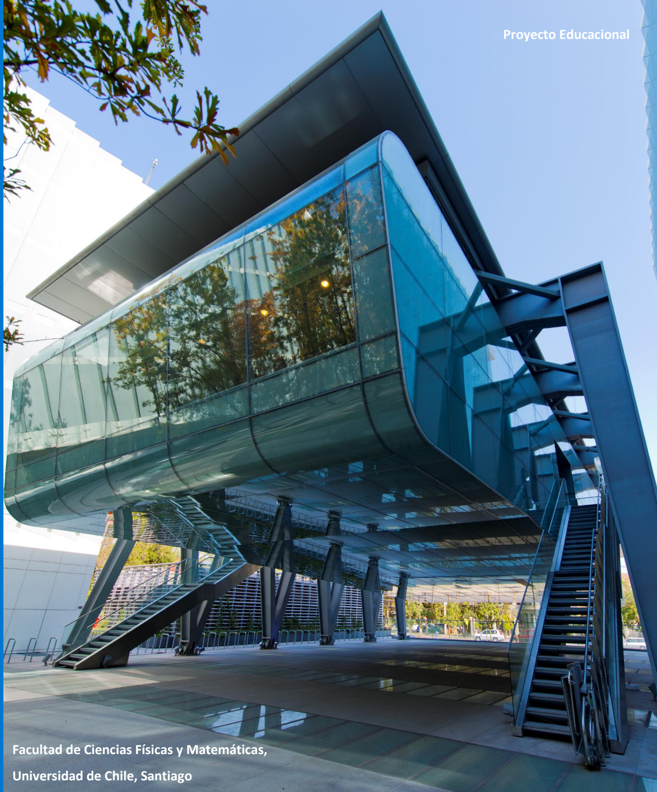
Facultad de Ciencias Físicas y Matemáticas, Universidad de Chile, Santiago