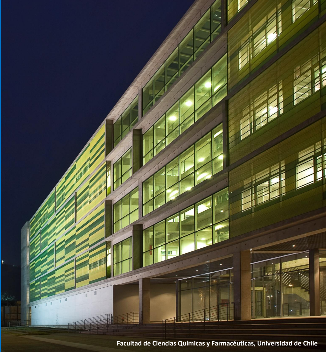
Facultad de Ciencias Químicas y Farmacéuticas, Universidad de Chile