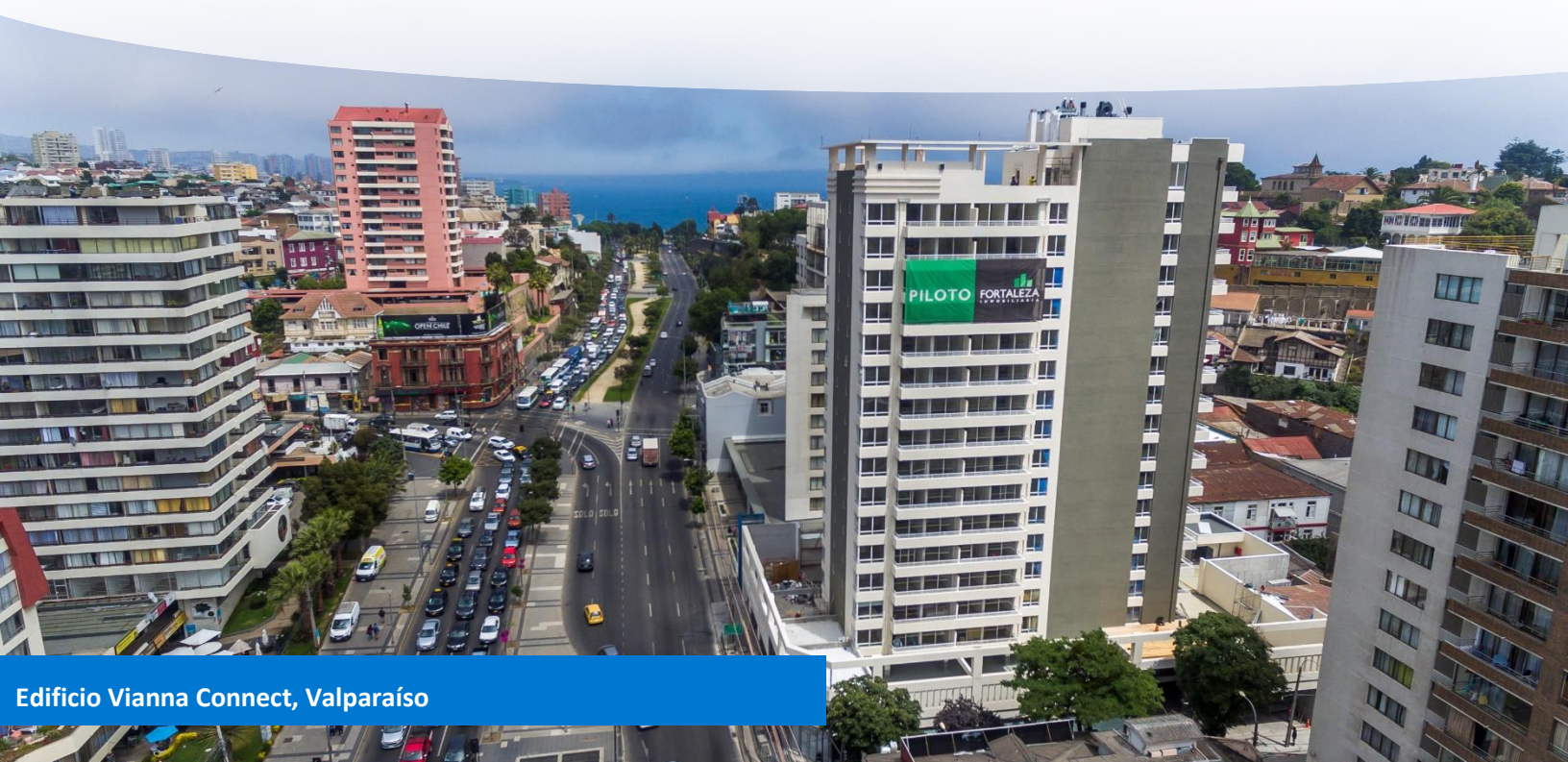
Edificio Vianna Connect, Valparaíso