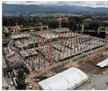
La construcción del Hospital de Angol está a cargo de Moller y Pérez-Cotapos.

obras públicas, habitacionales, centros comerciales, plantas industriales y viviendas sociales.